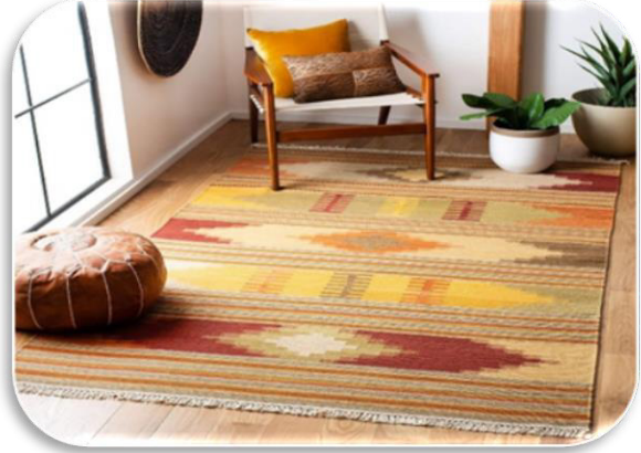
الشكل رقم (٢) يوضح الكليم الأسيوطي مع دمج ألوان الصوف الطبيعية (What Is A Kilim Rug, 2023)

وأهم استخدام للكليم سابقا أو حاليا هو استخدامه كمفروشات أرضية. (ابراهيم، ٢٠١٤ م)، كما يستخدم كأغطية للسرائر والأرائك والوسائد كما موضح بالشكل (٤)