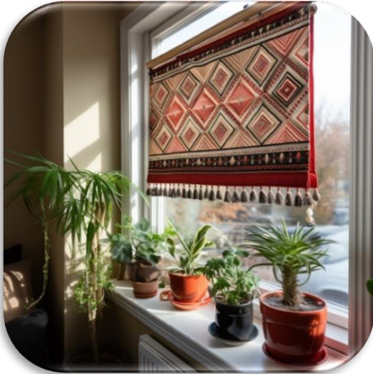
الشكل (٢٠) يوضح التجربة رقم ٩ محاكاة تصميم كليم في الستائر