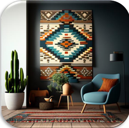
الشكل (٢١) يوضح التجربة رقم ١٠ محاكاة تصميم كليم كمعلقات