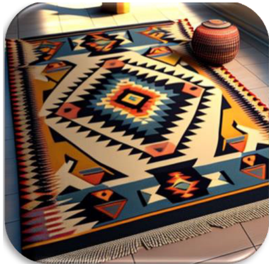
الشكل (١٣) يوضح التجربة رقم ٢ لتصميم الكليم كمفروشات للأرضية