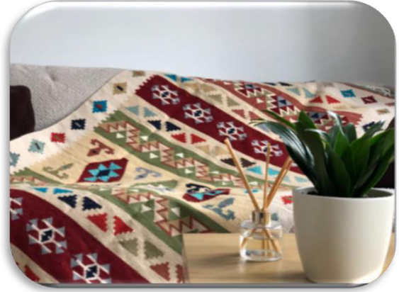
الشكل رقم (٣) يوضح توظيف للمنسوجات اليدوية كمفروشات أرضية (Etsy, 2023)