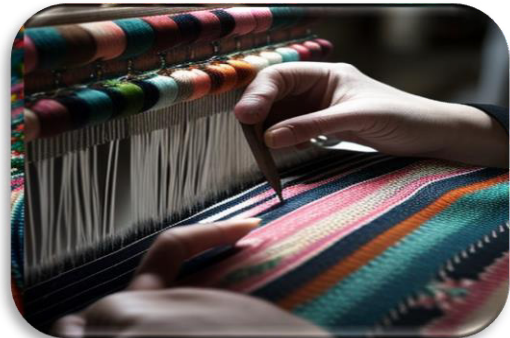
الشكل رقم (٧) يوضح محاكاة باستخدام الذكاء الاصطناعي للنول اليدوي

وقد وقع مركز تحديث الصناعة بروتوكول تعاون مع كلية الهندسة جامعة عين شمس وجمعية حماية البيئة من التلوث لتطوير "نول الكليم اليدوي"، وذلك انطلاقاً من اهتمام المركز بقطاع الصناعات الحرفية والتراثية ودوره في التنمية المجتمعية والاقتصادية من خلال برنامج الصناعات الإبداعية والحرفية. (صلاح، الثلاثاء ٠٩ مايو ٢٠٢٣ م)