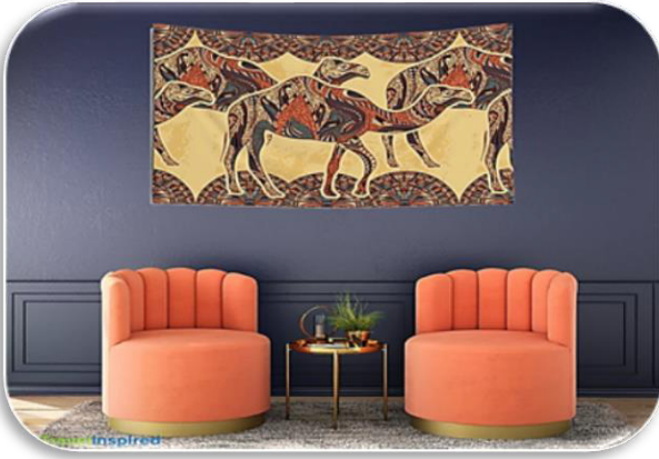
الشكل رقم (٥) يوضح محاكاة لمعلقة منسوجة يدويا (بأسلوب التابستري) (Etsy, 2023)

كما أن الألوان لابد أن تعكس البهجة والوقار التي تتطلبها وظيفة استخدام هذه المنسوجات التي تعتمد على خصائص مادتها الصوفية أو الحريرية وما لها من مزايا جمالية تبدو واضحة من نسجها عند تعرضه للضوء كما أن المهارة التي يتطلبها هذا الفن لازالت حتى اليوم مثار إعجاب الجميع. (أنور، ١٩٩١ م) ويتم نسج المعلقات بأسلوب اللحامات غير الممتدة التابستري (Tapestry)، ك لوحات فنية وتستخدم عادة للتعلق على الحوائط للزينة عنه كمفروشات للأرضية وتمثل في الغالب مناظر من القرية المصرية النابضة بالحياة والنشاط كما هو موضح بالشكل (٦،٥).