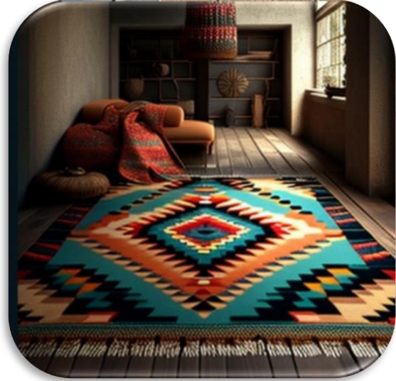
الشكل (١٢) يوضح التجربة رقم ١ لتصميم الكليم كمفروشات للأرضية