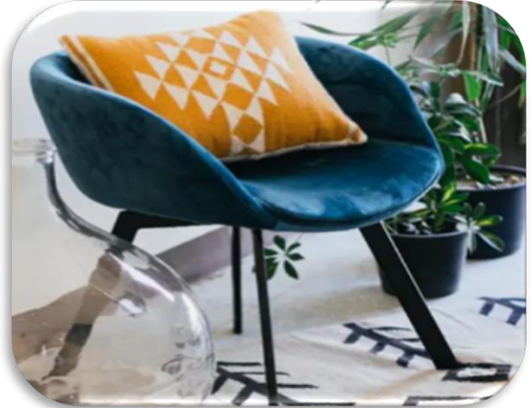
الشكل رقم (٤) يوضح المنسوجات اليدوية كوسائد (Kilim Cushion Covers) (كولومبوس، ٢٠٢٣)