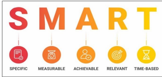
الشكل (٨) يوضح التخطيط طبقاً لنموذج SMART

Achievable - ذو صلة وملائم Relevant - متضمناً إطاراً زمنياً (Time-Based). (حامد، ٢٠٢٠م)