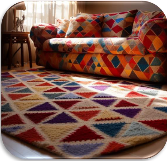
الشكل (١٤) يوضح التجربة رقم ٣ لتصميم الكليم كمفروشات للأرضية