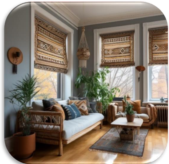
الشكل (١٩) يوضح التجربة رقم ٨ محاكاة تصميم كليم في الستائر