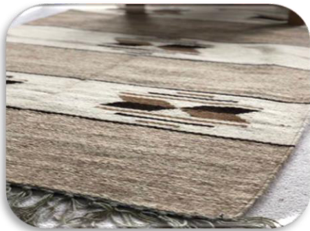
الشكل رقم (١) يوضح الكليم الحلواني المنسوج من الصوف الطبيعي (Etsy, 2023)

يوجد نوعين من الكليم، أحدهما الكليم الحلواني والآخر الأسبوطي. والكليم الحلواني يتم نسجه من الألوان الطبيعية للصوف مندرجا من اللون الكريم إلى اللون البني الغامق بأشكال هندسية موضحة بالشكل (١). (أمين، ٢٠١١)