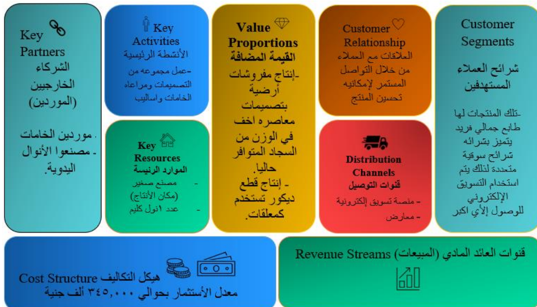
الشكل رقم (١١) يوضح نموذج لمخطط العمل التجاري لإنشاء مشروع لإنتاج المنسوجات اليدوية Business Model Canvas (BMC)

ويتم ذلك من خلال عمل خريطة التعاطف Empathy Map وذلك لمعرفة احتياجات العميل، وتعتبر المنتجات التي تنتجها الشركات الناشئة تجارب لقياس نبض السوق في شراء تلك المنتجات ومن خلال تلك التجارب يمكن التعديل على الأفكار لتناسب مع احتياجات العملاء كما هو موضح بالشكل (١٠). (ريس، ٢٠١٥م) يُعد نموذج العمل التجاري أحد أدوات التخطيط الاستراتيجي الأساسية التي تحدد أسس أنشطة الشركة التجارية. يتألف هذا النموذج من مجموعة من العناصر الأساسية لكل منتج أو خدمة، بهدف التخطيط الدقيق وفقاً للإمكانيات المتاحة. يوضح الشكل رقم (١١) هذا النموذج، حيث يتم استخدامه لتحديد التمويل اللازم للمشروع بحيث يكون حجم المبيعات أكبر من تكلفة الاستثمارية للمشروع، مما يساهم في تحقيق أرباح وجذب المستثمرين.