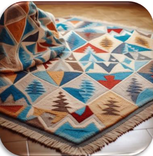
الشكل (١٦) يوضح التجربة رقم ٥ لتصميم الكليم كمفروشات للأرضية