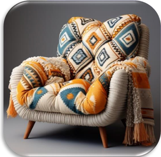
الشكل (١٨) يوضح التجربة رقم ٧ محاكاة تصميم كليم في الكراسي