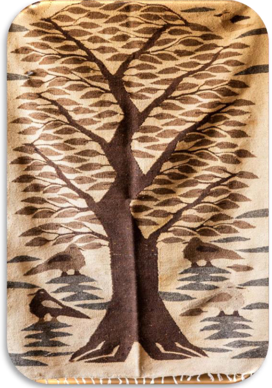
الشكل رقم (٦) يوضح قطعة منسوجة يدوياً كمعلقات (بأسلوب التابستري) (Workshop., 2023)

تُعرف أيضاً، بأنها عملية إنشاء منظمة أو تطوير منظمة قائمة؛ أو الاستجابة لفرص استثمارية جديدة من خلال الاستعداد لإدارة وتنظيم وتطوير المشروعات بالتزامن مع التأثير بالمخاطر؛ بهدف الوصول إلى الأرباح اعتماداً على المبادرة بإنشاء عمل جديد؛ بالاستفادة من الموارد المتاحة بجانب العمل ورأس المال. (جودة، ٢٠١٨ م)