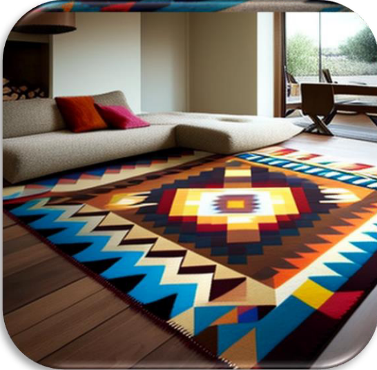
الشكل (١٥) يوضح التجربة رقم ٤ لتصميم الكليم كمفروشات للأرضية