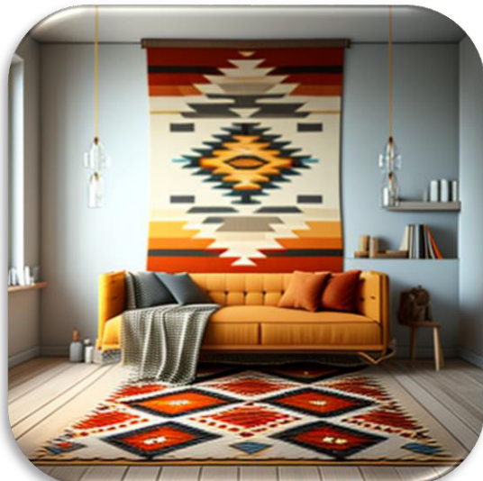
الشكل (٢٢) يوضح التجربة رقم ١٠ معلقات ومفروشات أرضية