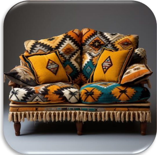
الشكل (١٧) يوضح التجربة رقم ٦ محاكاة تصميم كليم كوسائد